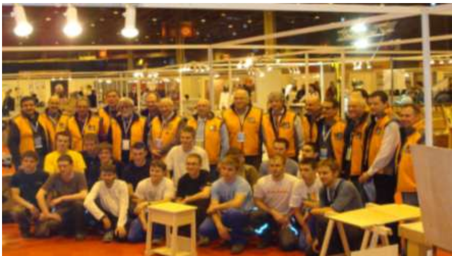
Quelques images de ces olympiades