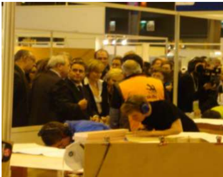
Des bas-normands enthousiastes lors de la remise des médailles au palais des sports

L'organisation de ces olympiades ouvertes au public avec 150 000 visiteurs permet la promotion des métiers, la reconnaissance et la valorisation des jeunes qui font le choix de la formation professionnelle.